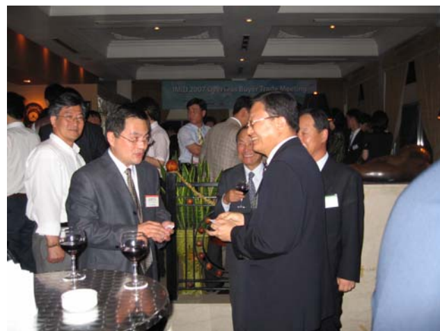
<제 3 회 IMID 2007 해외바이어초청 리셉션파티 모습>