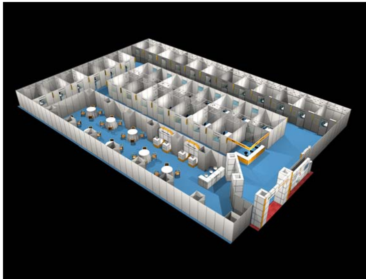
<제 4 회 IMID 2008 해외바이어초청 무역상담회 Area 전경>